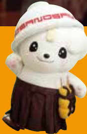
佐野ブランドキャラクター さのまる ©佐野市