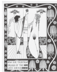
オーブリー・ピアズリー画 T. マロリー 『アーサー王の死』 1893-94年刊より 栃木県立美術館蔵