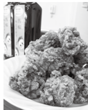
パパプロのソース唐揚げ

味付け決定までには何回も試作を重ね、無事3月のイベントでお披露目した「ソース唐揚げ」。今後は、この「ソース唐揚げ」にオリジナルの名称を付け、市内だけでなく、市外にもPRしていきます。