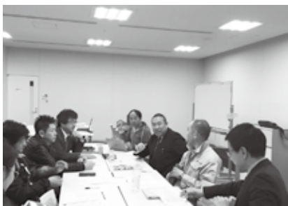
パパたちが佐野市のPRのため、話し合いを重ねています

佐野市の新しい魅力を商品として市内外にPRするとともに、新しい地域ビジネスを生み出す“佐野パパプロジェクト”。パパの目線で、佐野の新しい「芽」を洗い出し、絞り込みを行いました。