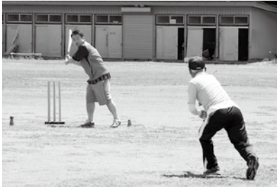
年齢に関係なくプレーをしている様子

毎年開催される「佐野社会人リーグ」には、市内の企業など約10チームが参加しており、前回の大会では60歳を超える選手も出場し、活躍しています。この大会では、企業のほか自治会、同級生チームなど、年齢や性別を問わず参加を募集しています。今年も、10月21日(土)に渡良瀬川緑地運動公園で開催します。初参加のチームには事前に講習会を行っていますので、職場での良好な人間関係づくりに、ぜひクリケットを活用してください！ (特定非営利活動法人日本クリケット協会 大鳥居悠貴)