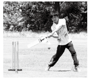
社会人リーグの試合風景

職場内でのスポーツは、自然に社員同士の距離が縮まり、業務上のチームワークの向上が図られるなど、その重要性が見直されています。そこでおすすめしたいのが、クリケットです。6人で1試合1時間程度、柔らかいボールでケガの心配も少なく、運動量も適度で、気軽にゲームを楽しむことができます。