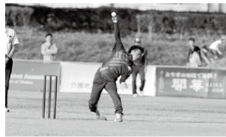
肘を曲げないで投球する日本代表選手

クリケットは野球の原型と言われますが、大きく異なる特徴が3つあります。1つ目は投手が助走をつけて、肘を曲げずに投球すること。2つ目は打者が360度どの方向に打っても良く、ファールがないこと。3つ目は守備が素手でボールをキャッチすることです。