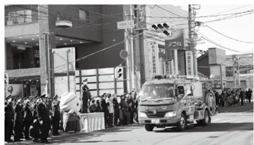
※写真は前回の様子