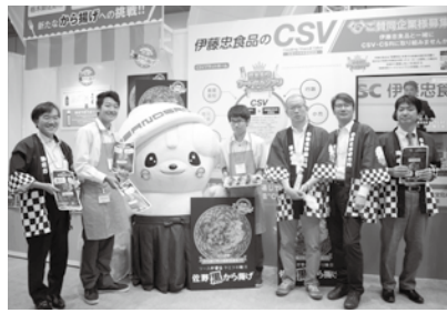
パパと高校生が「佐野黒から揚げ」をPR