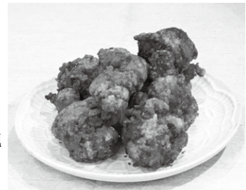
「佐野黒から揚げ」 ソースが香るヤミツキ味

「佐野らーめん、いもフライに続く、第三の佐野グルメを！」とパパたちが生み出した絶品のから揚げですが、このたび、その名称が決まりました。