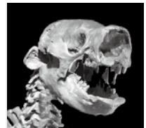
オオナマケモノ

ナマケモノというと、じっと動かない動物を思い浮かべますが、アメリカ大陸にいたナマケモノの仲間はなんと体長3m!陸上で生活していました。ただいま展示中です。」