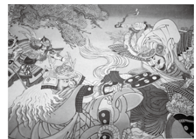
「川中島の戦い」(部分)