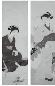
松本姿水《夏冬美人図》