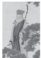
吉川霊華《寿老》 当館蔵(部分)