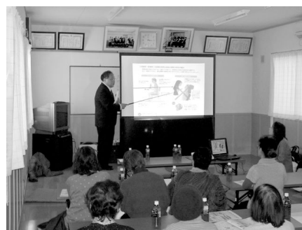
介護予防教室の様子