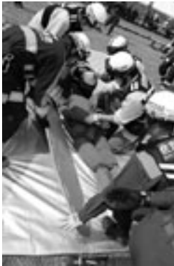
災害への備えを進め、安全・安心な街に

● 地域防災力の向上を図るため、防災訓練などを通じた啓発や、地域住民で組織する自主防災組織の設立・育成に努めます ● 災害発生時に迅速・的確な避難が図れるよう、ハザードマップに新たに指定された災害危険箇所を追加し市民の皆さんへ周知します ● 路線バス運行整備事業により、公共交通空白地域への新規路線の検討や地域の皆さんとの連携を図ります