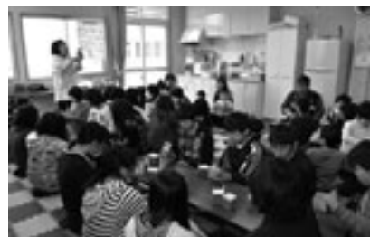
保育園の整備や民間こどもクラブの拡充をはかります