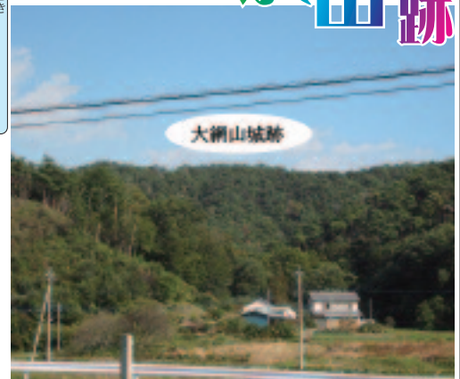
▲富士町にある大綱山城跡