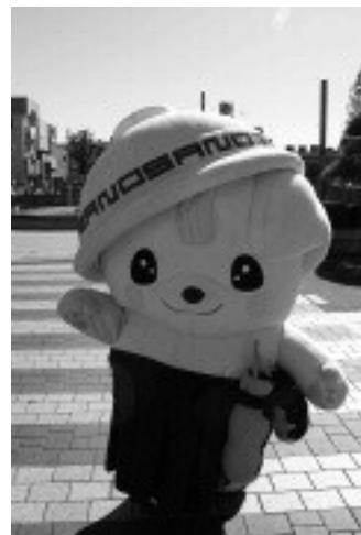
▲横断歩道は手を挙げて渡ろうね!!

○ほくは、佐野ブランドをPRするのがお仕事です。佐野ブランドをPRすることと佐野市を有名にするために、一生懸命頑張るので、みんな応援してください