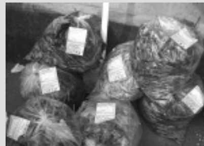
「多量にステーションに出された草」

写真のように、草や葉が多量にステーションに出されていることがあります。落ち葉・枯草・庭の刈り込みで出たものは、燃えるごみのほかに1回の収集で1世帯につき2袋までしか出せません。一度に多量に出る場合は、数回に分けて出してください。なお、土を落として、よく枯らして出してください。