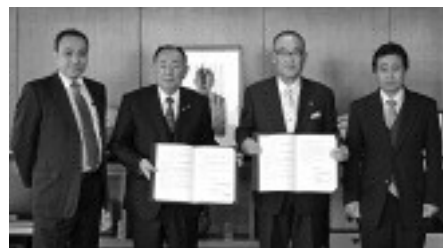
▲2月24日の調印式の様子

地域の高齢者の異変に気づいた時は、市または地域包括支援センターにご連絡ください。