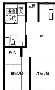
米山2DK車いす対応住宅間取り図