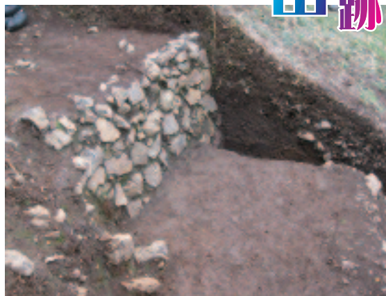
「隼人屋敷」西斜面の石垣と犬走り状通路

また、この曲輪の西側斜面中段では高さ約1mの石積みが見つかりました。この石積みの下は平らになっていて、犬走り状の通路跡があったと考えられます。 ・ 家中屋敷 道路わきに、低い石組溝が見つかりました。古い溝と幅を広げた新しい溝の2