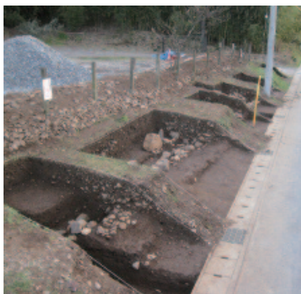
「家中屋敷」石組溝の状況

本で、屋敷脇の排水溝と考えられます。 ・ 御台所地区 今まで遺構が確認できなかった場所でしたが、2カ所で石列が見つかったため、本年度詳しい調査を行う予定です。