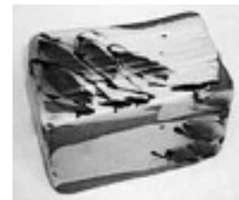
「ほたるぶくろ陶匣」