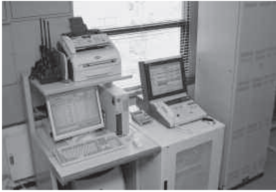
防災行政無線システム整備事業