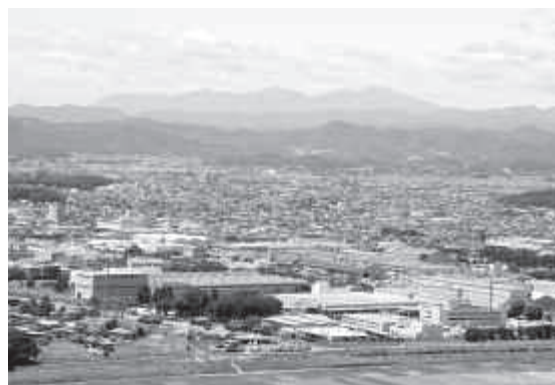
企業誘致促進事業