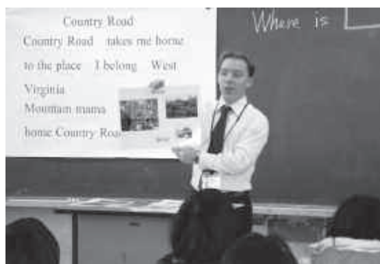
外国青年英語指導助手指導事業