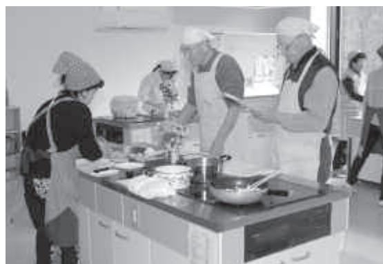
男女共同参画社会の実現を目指します