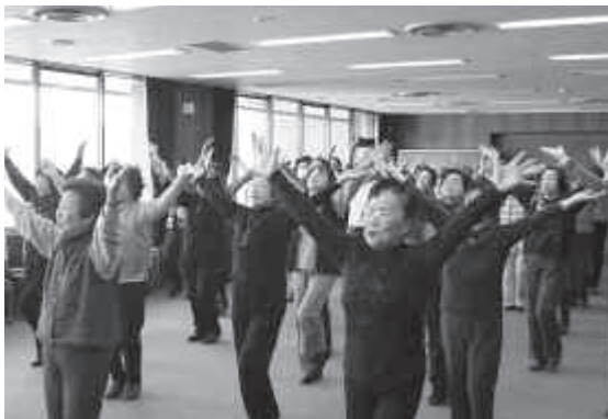
高齢者の心身の健康増進を図ります