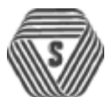
厚生労働大臣認可

※詳しくは、(財)栃木県生活衛生営業指導センター（☎028162512660）へお問い合わせください